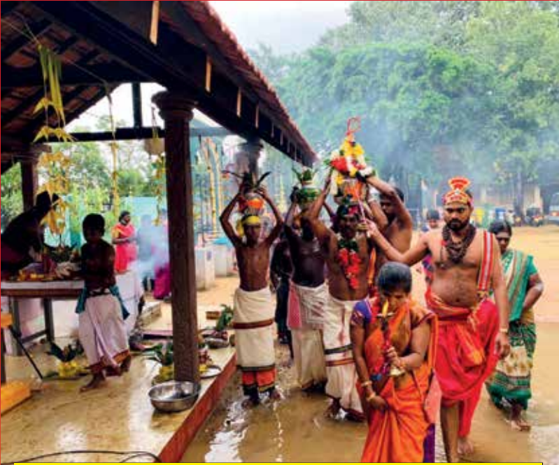
பரந்தன் இந்து மகா வித்தியாலயம் குடமுழுக்கு (20-02-22)