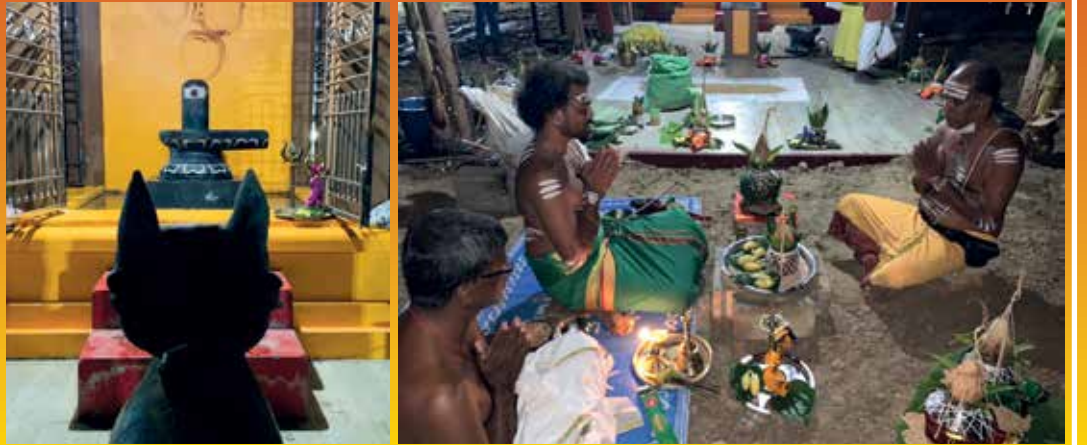
பூநகரி மத்திய கல்லூரி குடமுழுக்கு (6-02-2022)