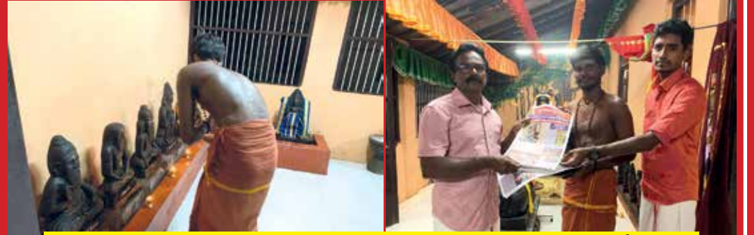
நிறைமதி வழிபாடும் தென்னாடு செய்தியிதழ் வெளியீடும்