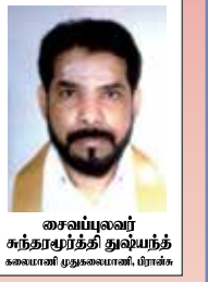
சைவப்பலவர் கந்தளாய் சிவன் கோயில் முதுகலைத் தரக்க