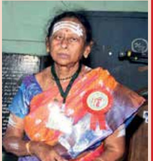
அருள்மிகு ஐம்பூதநாதர் துணைநிற்கட்டும்.