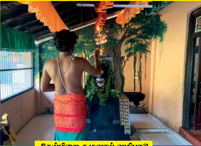
தேய்பிறை கழுவாய் வழிபாடு