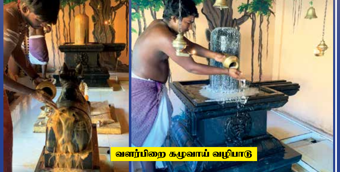
வளர்பிறை கழுவாய் வழிபாடு