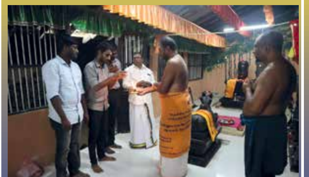
(15-02-2023)-தென்னாட்டில் "திருளழக்கூற்றிருக்கை" பதிகம் விண்ணப்பித்தல்