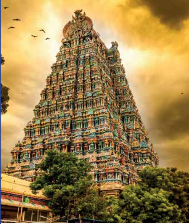
“ஞாலம் நிற்புகழே மிக வேண்டும் தென் ஆலவாயில் உறையும் எம் ஆதியே”

[தேவாரப் பாடல்பெற்று 274 சிவபுரங்களில் 192 ஆவது திருக்கோயில் - திரு ஆலவாய்]