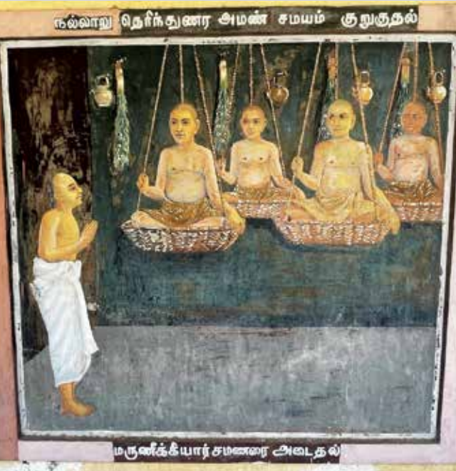
“திருநின்ற செம்மையே செம்மையாகக் கொண்ட திருநாவுக் கரையன்றன் அடியார்க்கும் அடியேன்”