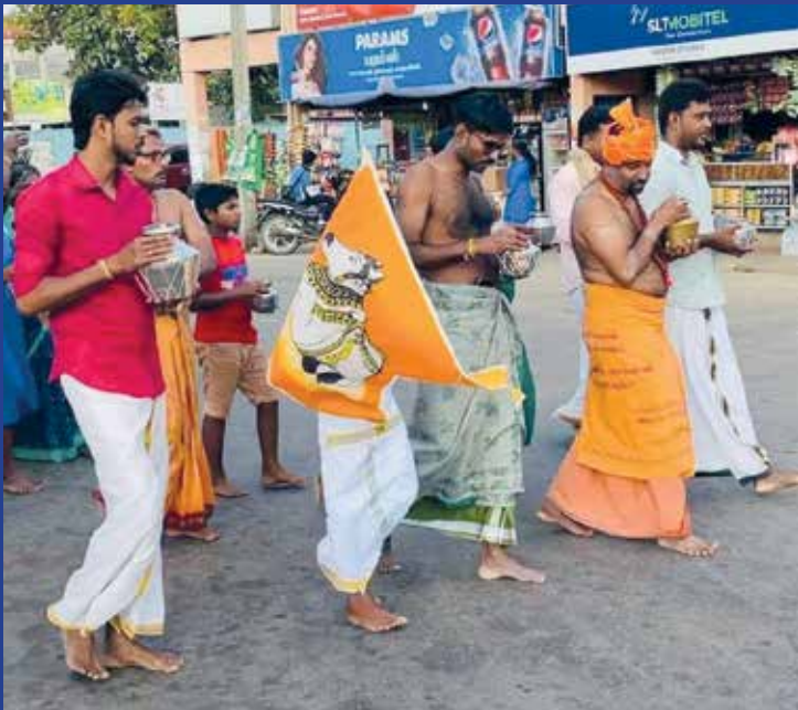
"மாதர்ப் பிறைக்கண்ணி யானை மலையான் மகளொடும் பாடிப் போதொடு நீர்சுமந்து ஏத்திப் புகுவார்"

சாவகச்சேரி பேருந்து நிலைய நீதிமன்ற வளாகத்தில் அமைந்துள்ள அருள்மிகு வாரி வனேசர் திருக்கோயிலில் பெருஞ்சிவனிரவு வழிபாடுகள் சிறப்பாக இடம்பெற்றிருந்தது. நான்கு சாமப் பூசைகளும் திருமஞ்சனங்களுடன் சிறப்பாக இடம்பெற்றிருந்தது. சாவகச்சேரி வாழ் மக்கள் பெருமளவானோர் இவ்வழிபாட்டில் கலந்து சிறப்பித்திருந்தனர்.