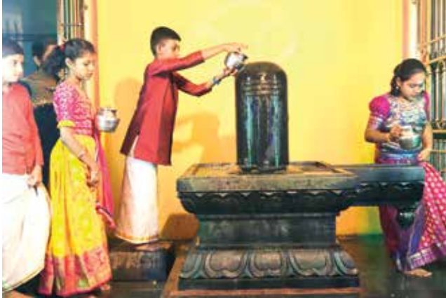
“தானேவந்து எனது உள்ளம் புருந்தடி அடியேற்கு அருள் செய்தான்”

சைவத்தினையும், தமிழினையும் பேணிப் பாதுகாக்கவும், மேன்மையுறச் செய்யவும் எடுத்த விடாமுயற்சியின் விளைவால் தோன்றிய யாழ் இந்து ஆரம்ப பாடசாலையின், நோக்கங்களை மீண்டும் வலுப்படுத்தவும், இளமையிலேயே குழந்தைகளுக்கு சைவநெறியின் ஆதித் தன்மையையும், தனித்துவத்தினையும், பெருமைகளையும் சிவவழிபாட்டின் ஊடாகப் பெற்றுக்கொடுப்பதற்கும், அத்துடன் மாணவர்கள் அறிவுடன் சேர்த்து ஞானத்தினையும் பெற்றிடவும், மேலாக அவர்கள் மத்தியில் ஏற்றத் தாழ்வு அற்ற முறையில் வழிபாட்டு முறையினை அறிமுகப்படுத்தி அவர்களாகவே எங்கள் பரம்பொருளை போற்றி வழிபடும் சந்தர்ப்பத்தினைக் கொடுக்கவும், பாடசாலையில் சிவனுக்கு ஒரு கோயில் வேண்டும் என்ற சிந்தனையின் வெளிப்பாடே “மங்களநாதர்” திருக்கோயிலின் தோற்றமாகும்.