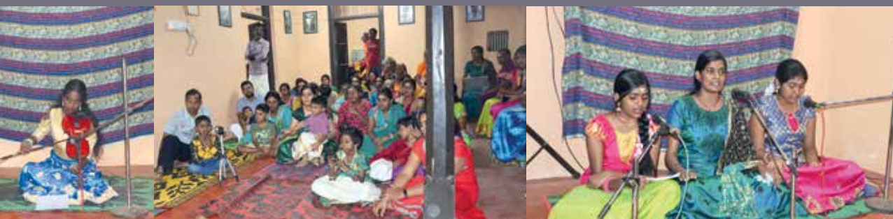
(18-02-2023) - பெருஞ்சிவனிரவில் தென்னாட்டு அறநெறி மாணவர்களின் கலை நிகழ்வுகள்