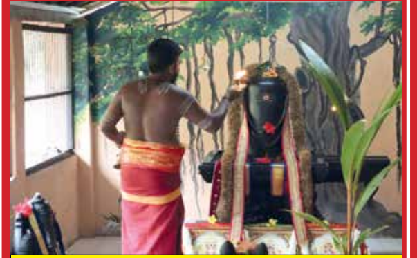
(01-02-2023) - செந்தமிழ் முறையில் புதுமனை புகுவிழா வழிபாடு