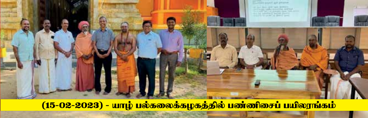
(15-02-2023) - யாழ் பல்கலைக்கழகத்தில் பண்ணிசைப் பயிராங்கம்