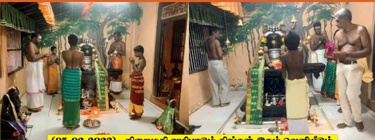
(05-02-2023) - நிறைமதி வழிபாடும் திங்கள் இதழ் வெளியீடும்