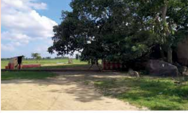
நாதனை விக்கைட்டிப் பங்கு கிடம்பெற்றுவந்த நாதனை நாச்சியார் கல்வடி பிள்ளையார் கோயில், வெல்லாவெளி.

கி.மு 300 நூற்றாண்டுகளுக்கு முன் வாழ்ந்த தமிழர் கிராமத்தில் குடி கொண்டு ஆதி சிவன் கோயில் வெல்லாவெளி கோயில்தீவு சிவன் கோயில்