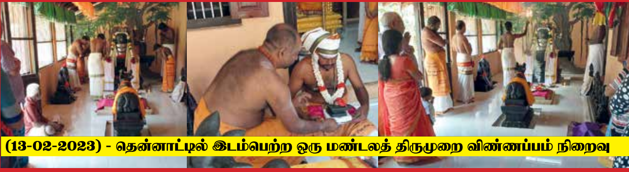
(13-02-2023) - தென்னாட்டில் இடம்பெற்ற ஒரு மண்டலத் திருமுறை விண்ணப்பம் நிறைவு