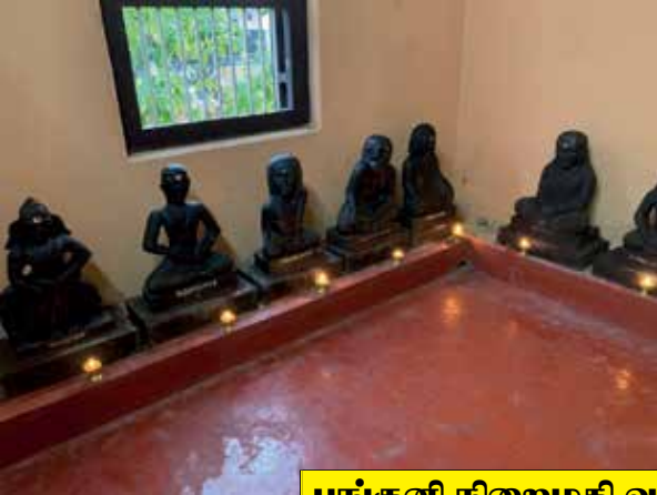
பங்குனி நிறைமதி வழிபாடுகள்