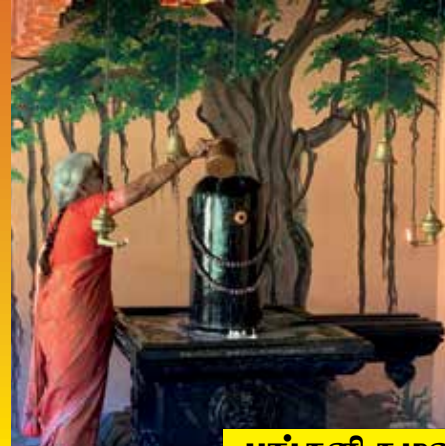
பங்குனி கழுவாய் வழிபாடு