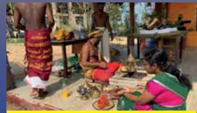
பூநகரி மத்திய கல்லூரி சங்கு நீராட்டு