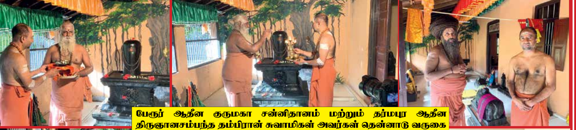
பேரூர் ஆதீன குருமகா சன்னிதானம் மற்றும் தர்மபுர ஆதீன திருஞானசம்பந்த தம்பிரான் சுவாமிகள் அவர்கள் தென்னாடு வருகை