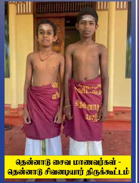
தென்னாடு சைவ மாணவர்கள் - தென்னாடு சிவஸூரியார் திருக்கூட்டம்