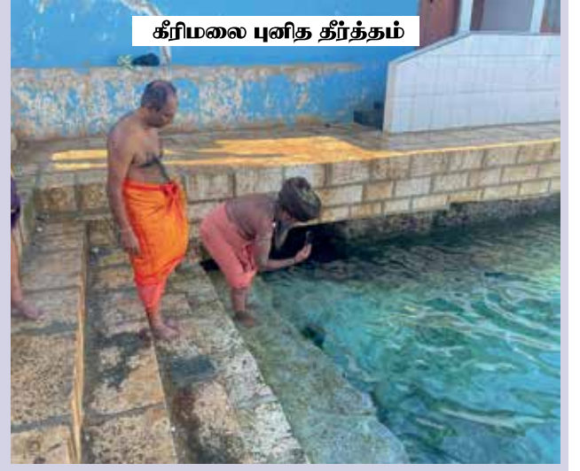
கீரிமலை புனித தீர்த்தம்