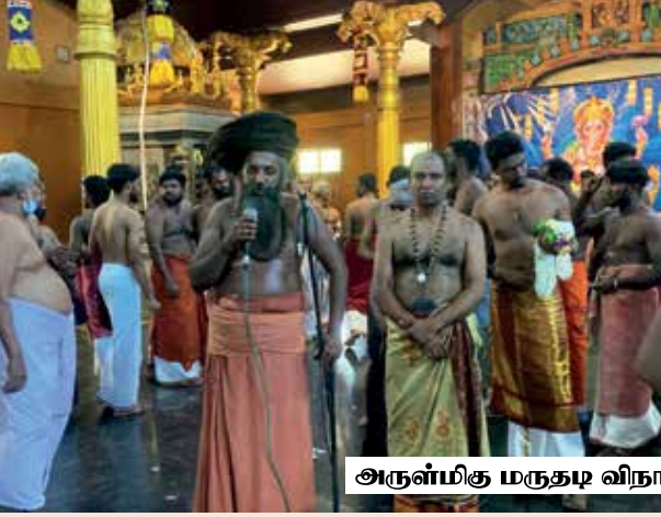
அருள்மிகு மருதழ விநாயகர் திருக்கோயில்