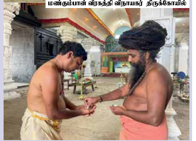
மண்கும்பான் வீரகத்தி விநாயகர் திருக்கோயில்