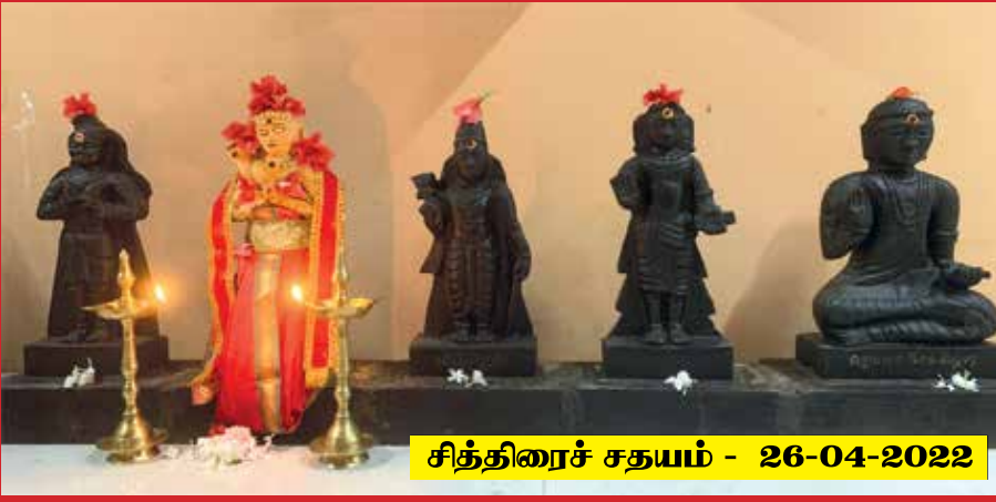
சித்திரைச் சதயம் - 26-04-2022