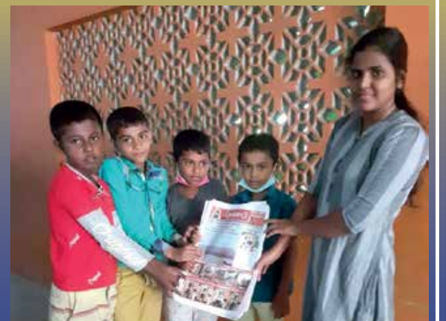
தென்னாடு இதழ் வழங்கல்