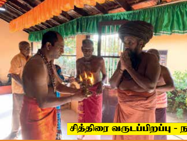
சித்திரை வருடப்பிறப்பு - நற்செய்கை (14-04-2022)