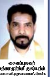
சைவப்புவர் சுந்தரமூர்த்தி துஷ்யந்த் கலாணி முதலமைச்சர், பிரபலம்