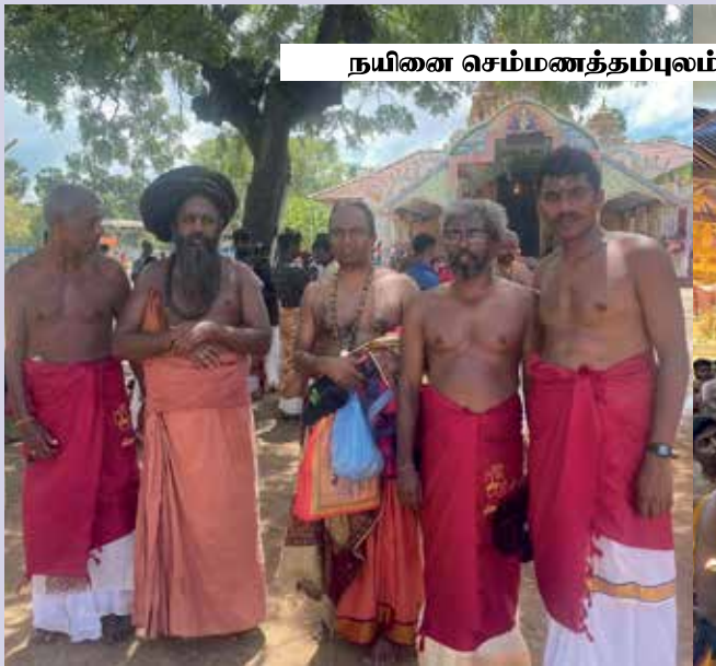
நயினை செம்மணத்தம்புலம் வீரகத்தி விநாயகர் திருக்கோயில்