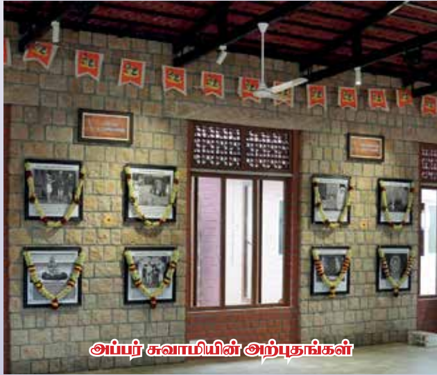
அப்பர் சுவாமியின் அற்புதங்கள்