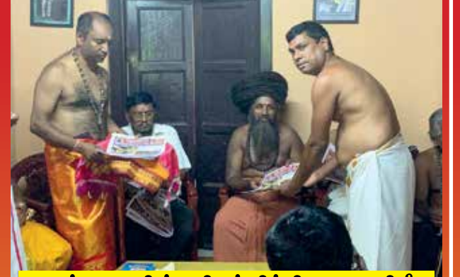
தென்னாடு திங்களிதழ் சித்திரை வெளியீடு