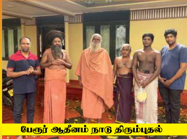
பேரூர் ஆத்னம் நாடு திரும்புதல்