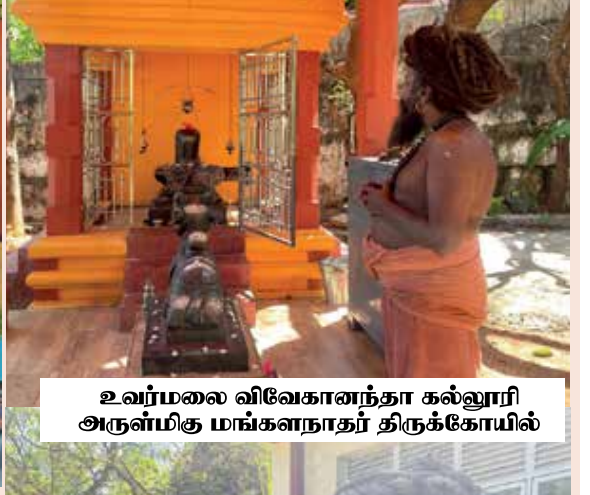
உவர்மலை விவேகானந்தா கல்லூரி அருள்மிகு மங்களநாதர் திருக்கோயில்