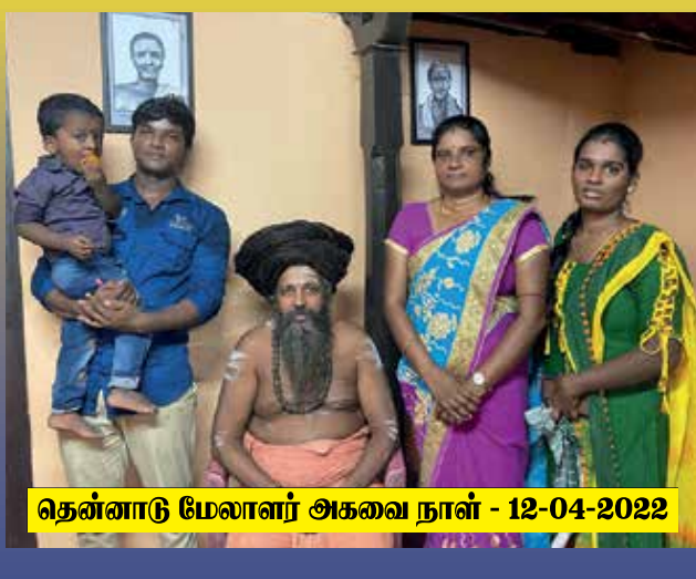
தென்னாடு மேலாளர் அகவை நாள் - 12-04-2022