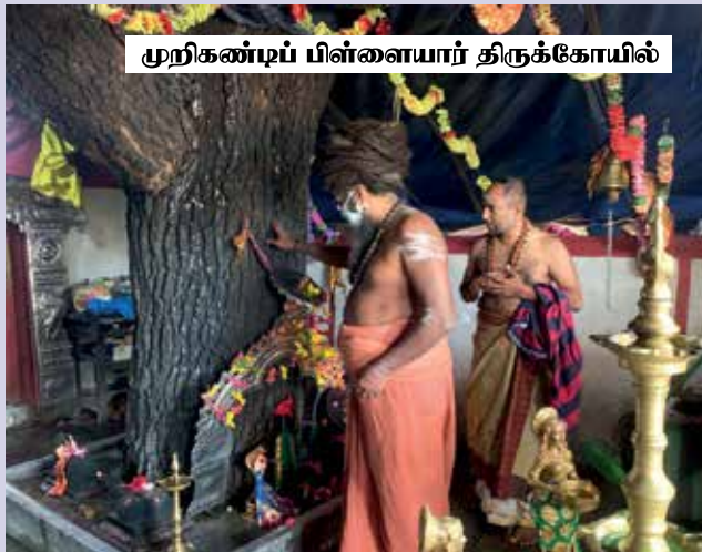
முறிகண்டிப் பிள்ளையார் திருக்கோயில்