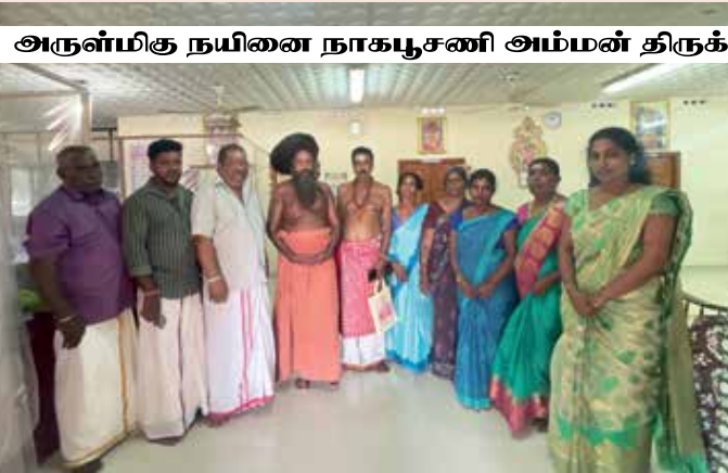
அருள்மிகு நயினை நாகபூசணி அம்மன் திருக்கோயில்