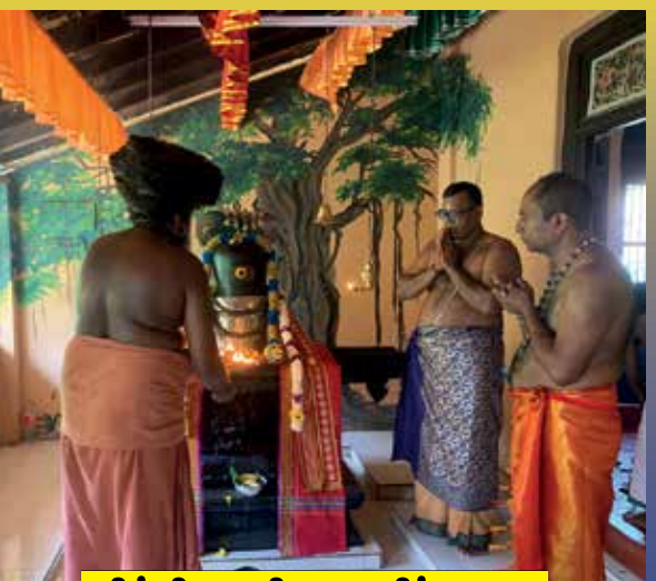
சித்திரை நிறைமதிப் பூசை