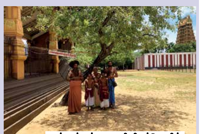
நல்லூர் கந்தசுவாமி திருக்கோயில்