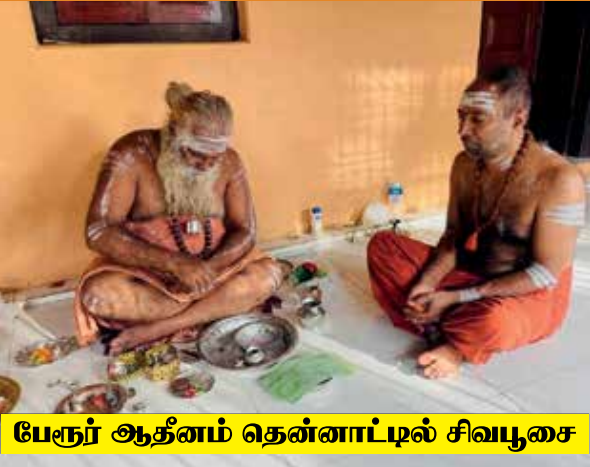
பேரூர் ஆத்னம் தென்னாட்டில் சிவபூசை