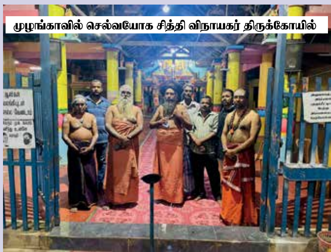
முழுங்காவில் செல்வயோக சித்தி விநாயகர் திருக்கோயில்