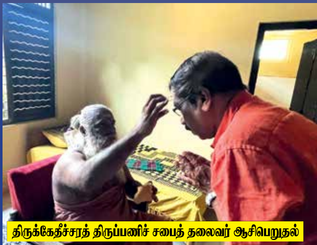
திருக்கேதீச்சரத் திருப்பணிச் சபைத் தலைவர் ஆசிபெறுதல்