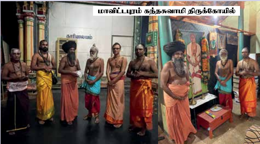
மாவிட்டபுரம் கந்தசுவாமி திருக்கோயில்