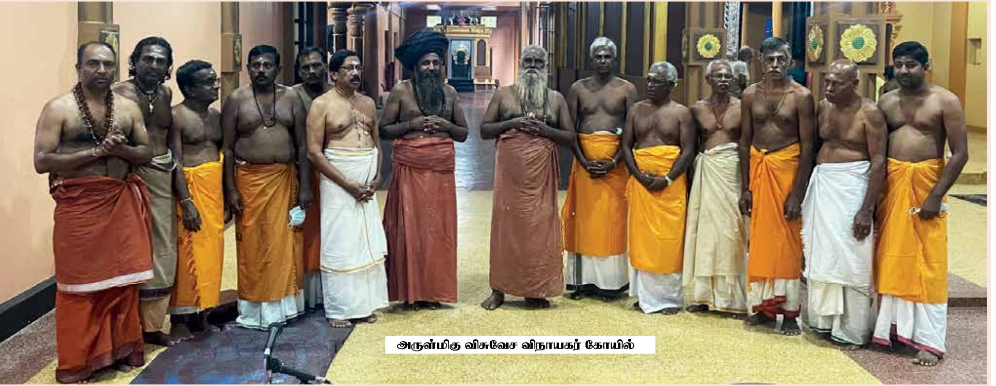
அருள்மிகு விசுவேச விநாயகர் கோயில்