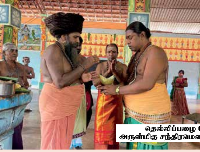
தெல்லிப்பழை கோயில்புலம் அருள்மிகு சந்திரமௌளீசர் திருக்கோயில்