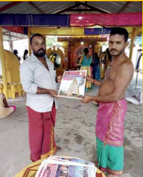
தென்னாடு திங்கள் இதழ் வழங்கல்