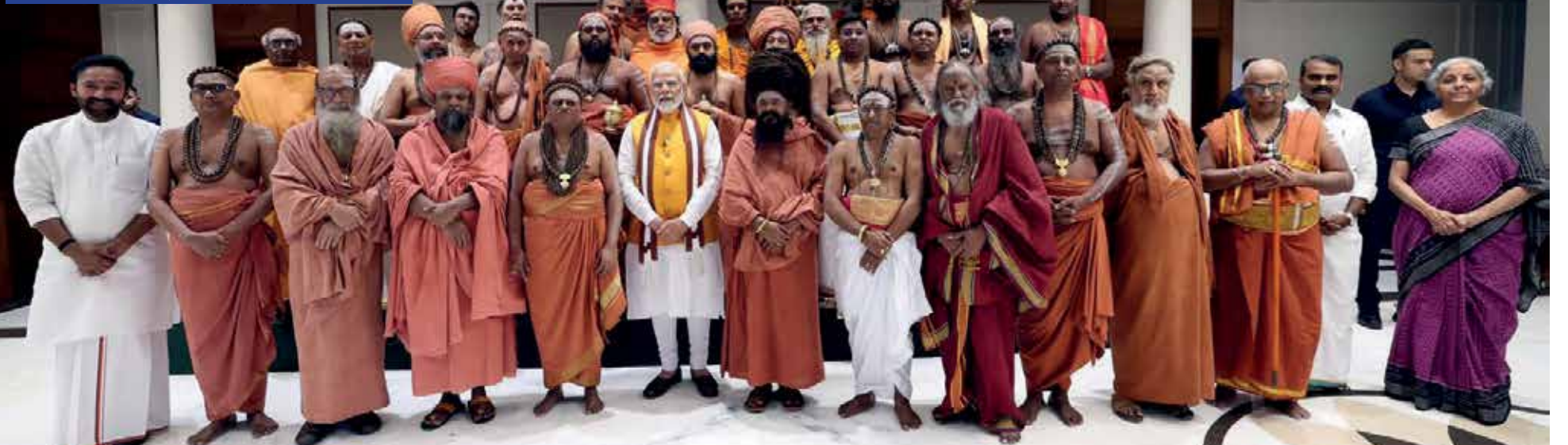
தமிழ்நாடு சைவ ஆதீனங்களுடன் இந்தியப் பிரதமர் நரேந்திர மோடி அவர்கள்