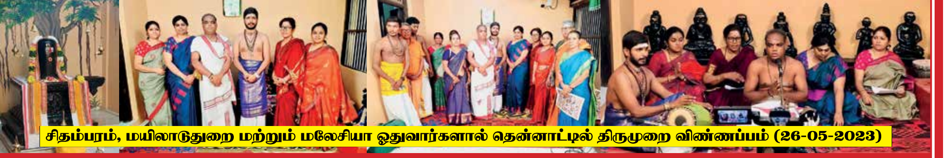
சிதம்பரம், மயிலாடுதுறை மற்றும் மலேசியா ஓதுவார்களால் தென்னாட்டில் திருமுறை விண்ணப்பம் (26-05-2023)