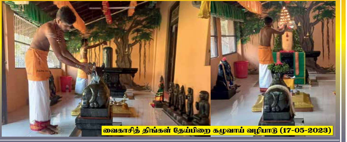
வைகாசித் திங்கள் தேய்பிறை கழுவாய் வழிபாடு (17-05-2023)