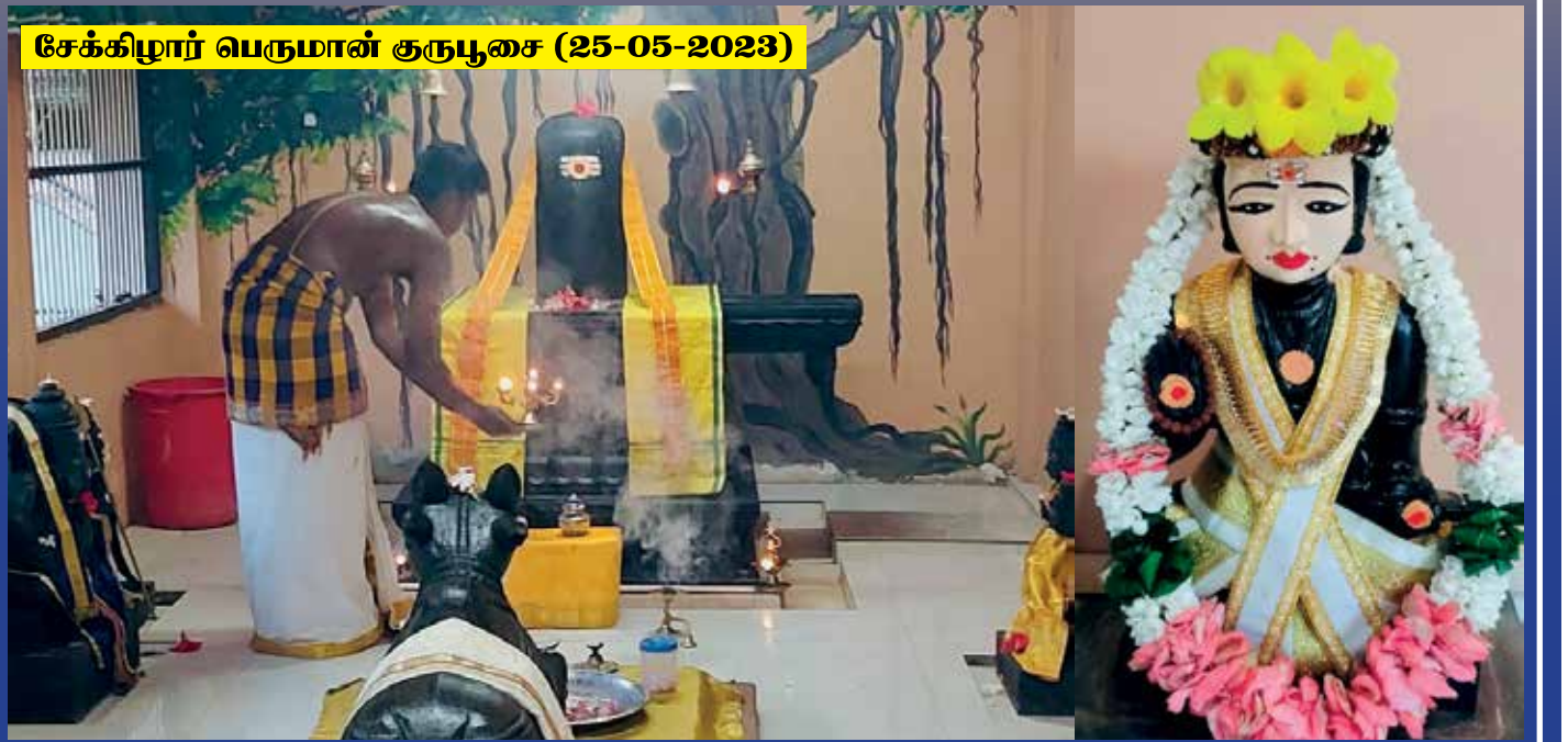
சேக்கிழார் பெருமான் குருபூசை (25-05-2023)