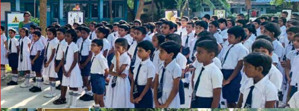
யாழ்ப்பாணம் இந்து ஆரம்ப பாடசாலை நற்சிந்தனை நிகழ்வு