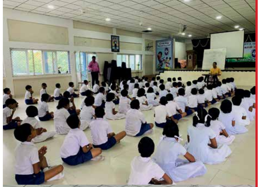
யாழ்ப்பாணம் இந்து ஆரம்ப பாடசாலை பண்ணிசை வகுப்பு