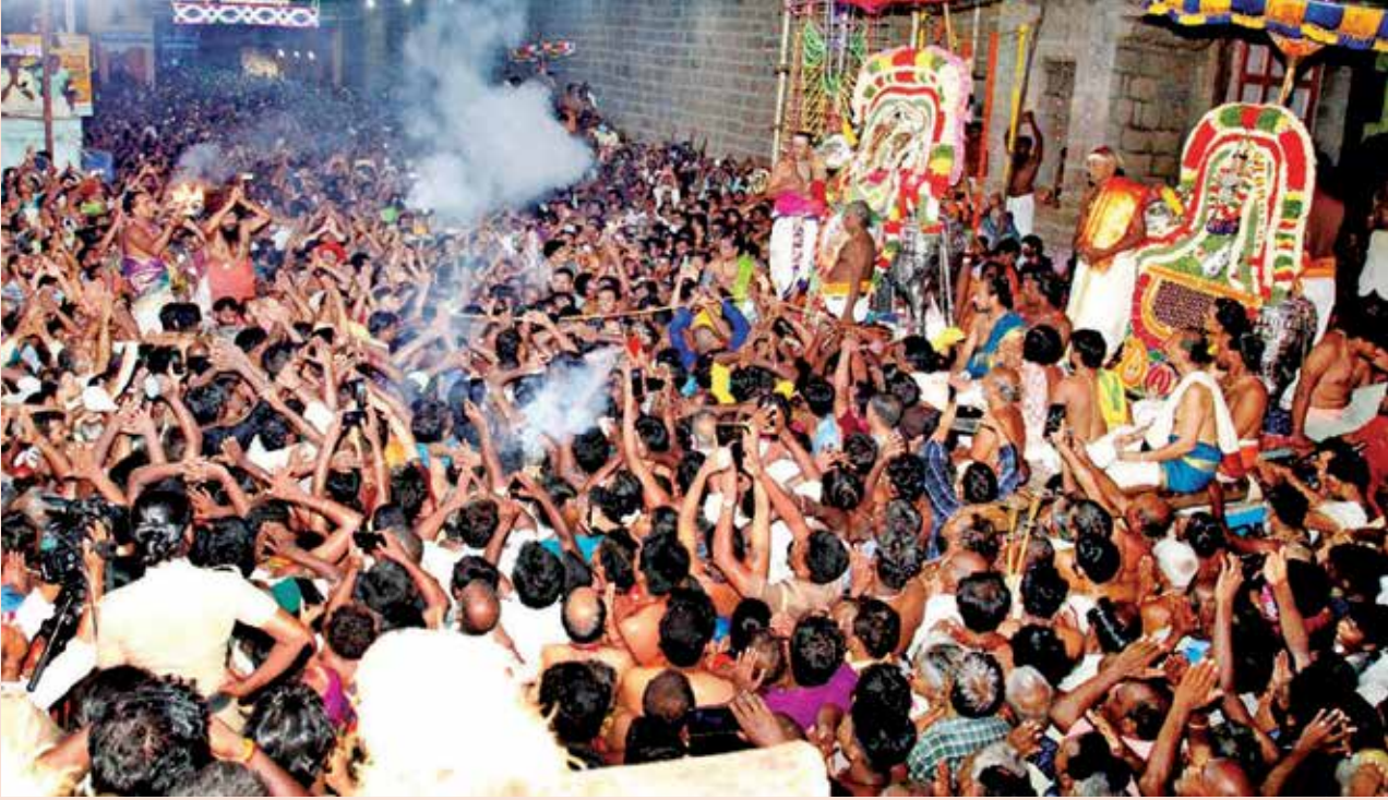
தருமை ஆதீனத்தின் ஏற்பட்டில் அப்பர் பெருவிழாவானது, திருவையாற்றில் அருள்மிகு பெருமானுக்கு திருக்கயிலாயக் காட்சிப் ஐயாறப்பர் திருமுன்னரில், வருகின்ற ஆடித்

திங்கள் 31ம் நாள் (16-08-2023) ஆடி மறைமதி நாளன்று மாலை 6 மணியளவில் இடம்பெறவுள்ளது.