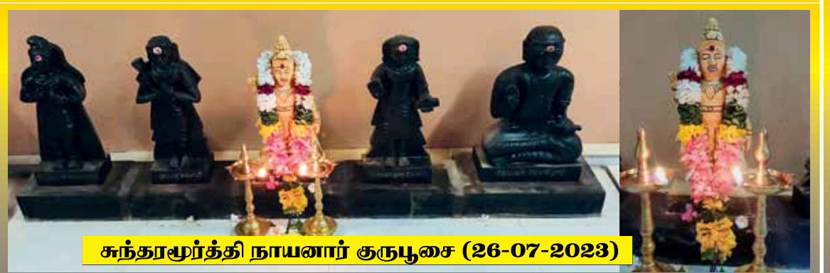
சுந்தரமூர்த்தி நாயனார் குருபூசை (26-07-2023)