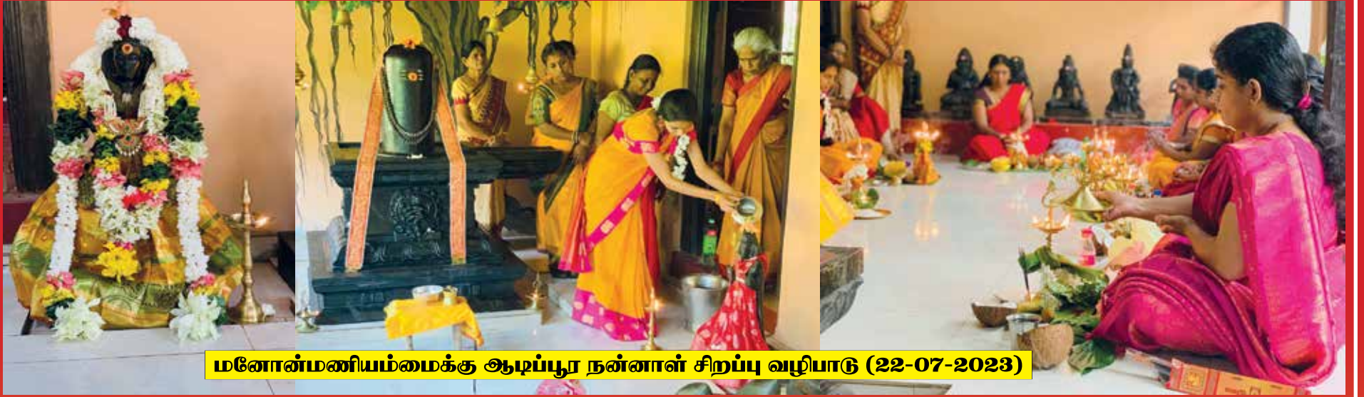
மனோம்ணியம்மைக்கு ஆடிப்பூர நன்னாள் சிறப்பு வழிபாடு (22-07-2023)