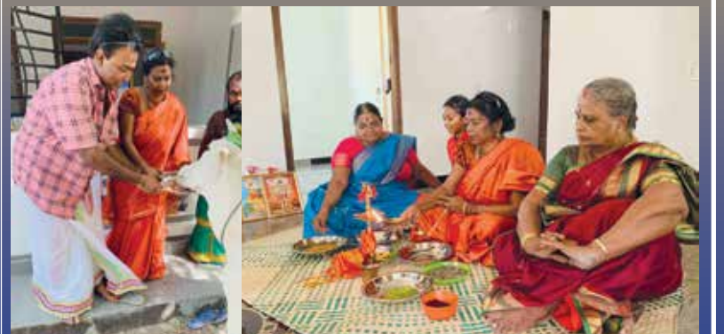
நயினாத்வில் தெய்வத்தமிழில் புதுமனைப் புகழிழா (06-07-2023)