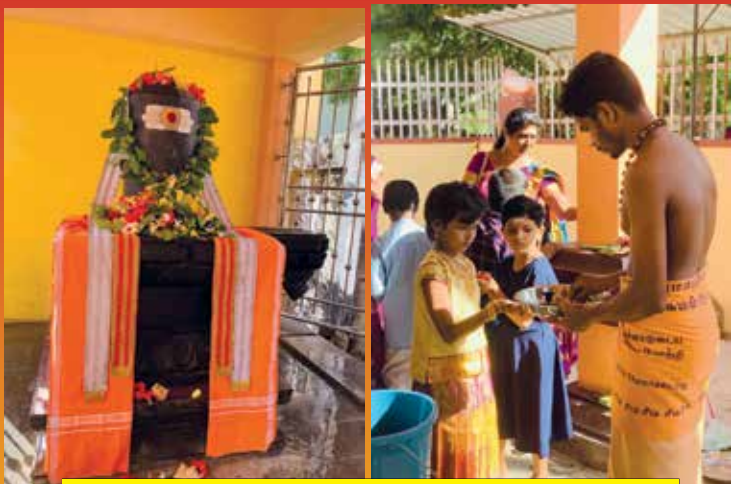
தாயுமானவர் சுவாமி திருக்கோயிலில் சனிக்கழுவாய் வழிபாடு (15-07-2023)