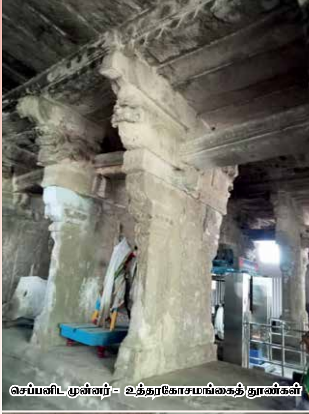
செப்பனிட முன்னர் - உத்தரகோசமங்கைத் தூண்கள்