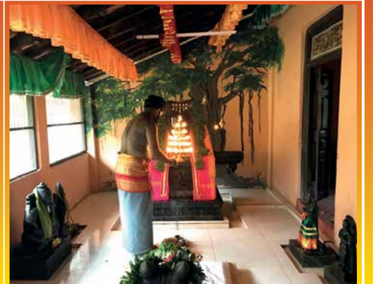
ஆவணித் திங்கள் தேய்யிறை கழுவாய் வழிபாடு (24.08.2022)