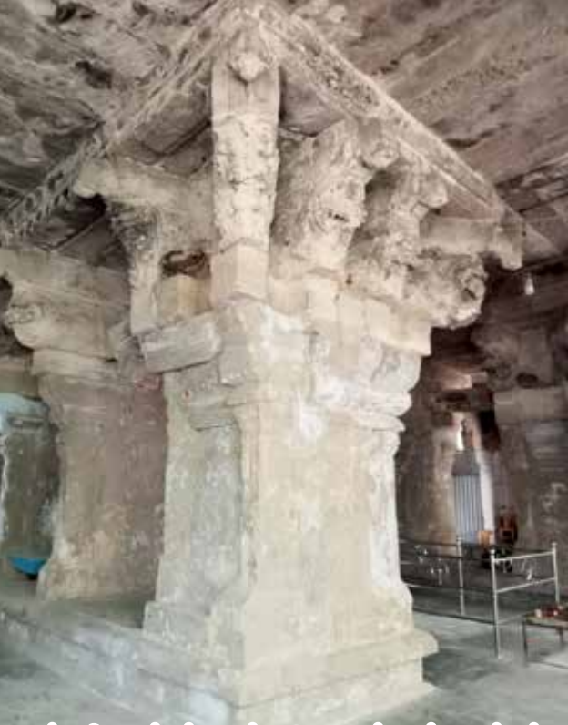
செப்பனிட முன்னர் - உத்தரகோசமங்கைத் தூண்கள்

அத்துடன் திருநாவுக்கரசு நாயனார் கரையேறிய இடமான கரையேற விட்ட குப்பம் மற்றும் மணிவாசக பெருமான் அவதாரம் செய்த இல்லமான திருவாதவூர் இல்லம்