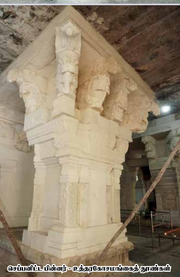
செப்பனிட்ட பின்னர் - உத்தரகோசமங்கைத் தூண்கள்