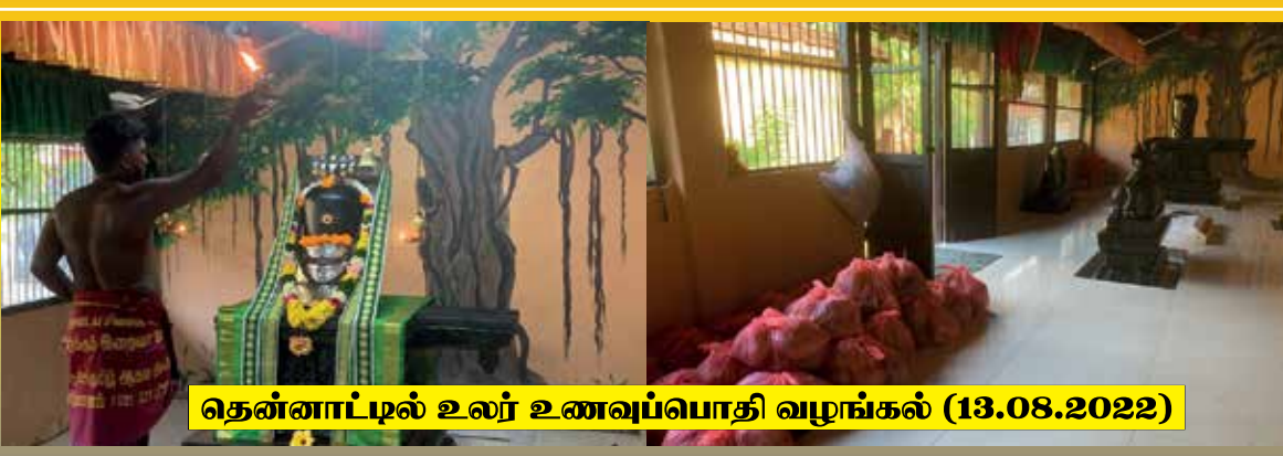
தென்னாட்டில் உலர் உணவுப்பொதி வழங்கல் (13.08.2022)