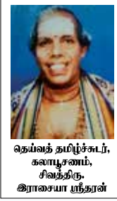
வதவத் தமிழ்ச்சுடர், கலாபூசணம், சிவகந்தி, இராசையா ஸ்தானம்

பிடியதன் உருவமை கொளமிது கரியது வடிவொடு தனதடி வழிபடும் அவரிடர் கடிக்கையதி வர அருளினன் மிகுகொடை வடிவினர் பயில்வலி வலமுறை இறையே.