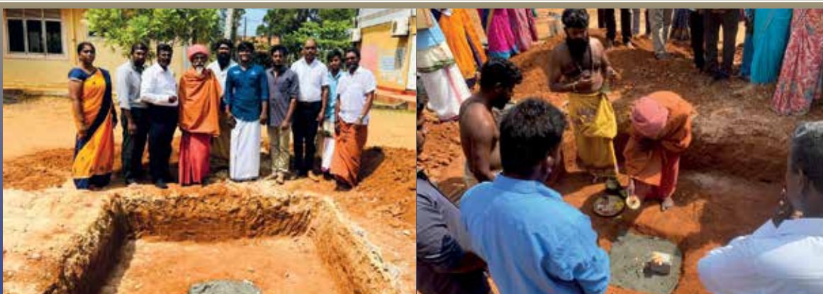
முழங்காவிலில் சிவன் கோயிலுக்கு அடிக்கல் நாட்டல் (19.08.2022)