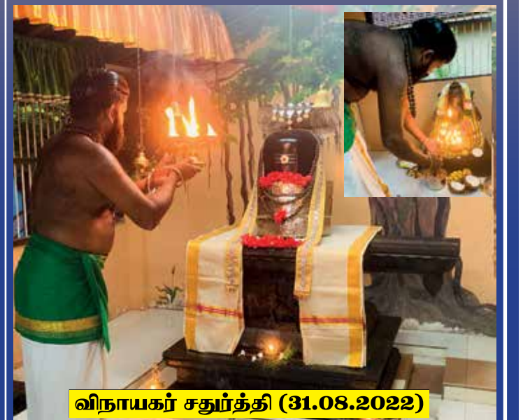
விநாயகர் சதுர்த்தி (31.08.2022)