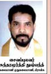
சைவப்பலவர் கந்தரபூர்த்தி துஷ்யந்த் கலையாணி முதலகலையாணி, பரங்கல்

இத்திருக்கோயிலின் மூலவர், தானாகத் தோன்றி சுயம்பு வடிவில் கோயில் கொண்டு, அடியவர்களுக்கு அருள் சொரிந்து வருகின்றார். பொதுவாக இலிங்க வகைகளுக்குள்ளே தனிச்சிறப்பு மகிமையும் கொண்டது தான்தோன்றி இலிங்கமாகும். இது யாராலும் உருவாக்கப்படாமல் தானாகவே ஒப்பற்ற கருணைவடிவமாக, அவ்வப்போது தோன்று இலிங்கமாகும்.