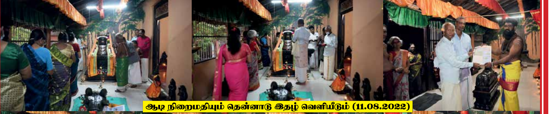
ஆடி நிறைமதியும் தென்னாடு இதழ் வெளியீடும் (11.08.2022)