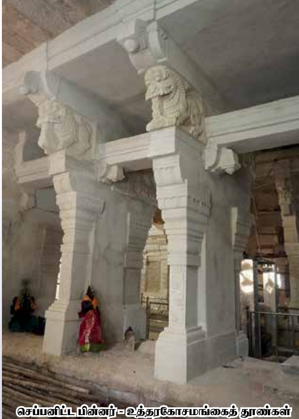
செப்பனிட்ட பின்னர் - உத்தரகோசமங்கைத் தூண்கள்

போன்றவற்றை முழுமையான கற்றளி கோயிலாக அமைக்கவும் திருவருளும் குருவருளும் கூடியுள்ளது. நமது அரன்பணி அறக்கட்டளை மூலமாக 103 திருகோயில்களில் திருப்பணிகள் மேற்கொள்ளப்பட்டு, 78 இடத்தில் திருப்பணிகள் நிறைவு செய்யப்பட்டுள்ளது. மற்ற இடங்களில் திருப்பணிகள் நடைபெற்று வரகின்றது.