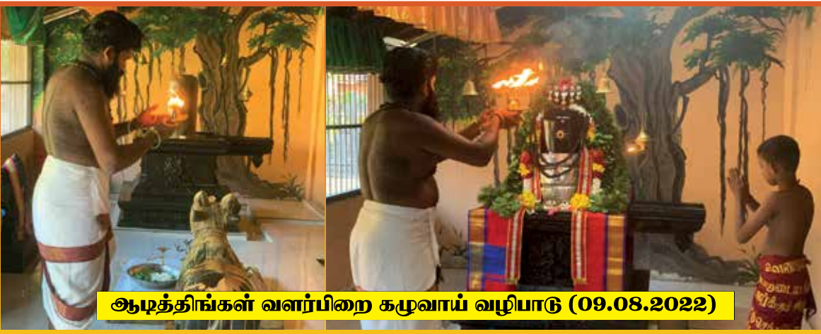
ஆடித்திங்கள் வளர்யிறை கழுவாய் வழிபாடு (09.08.2022)