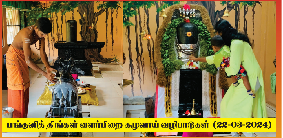
பங்குனித் திங்கள் வளர்பிறை கழுவாய் வழிபாடுகள் (22-03-2024)