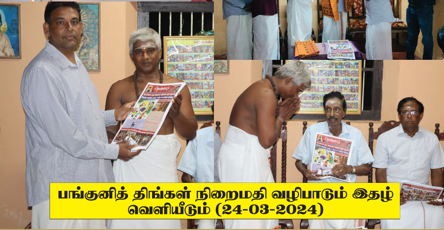
பங்குனித் திங்கள் நிறைமதி வழிபாடும் இதழ் வெளியீடும் (24-03-2024)