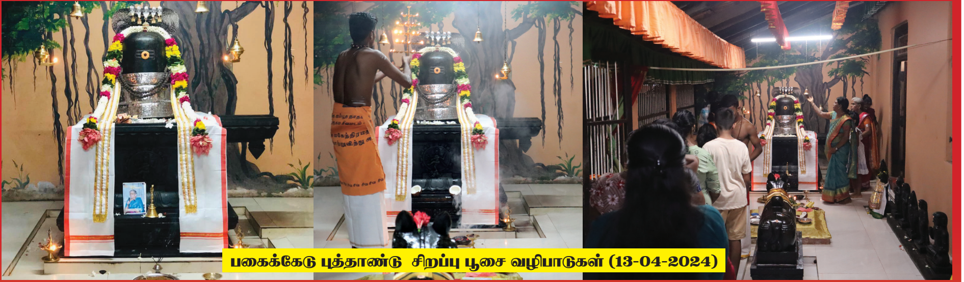
பகைக்கேடு புத்தாண்டு சிறப்பு பூசை வழிபாடுகள் (13-04-2024)