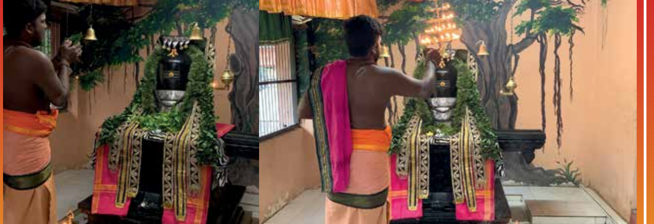
கார்த்திகைத் திங்கள் தேய்பிறை கழுவாய் வழிபாடு (21-11-2022)