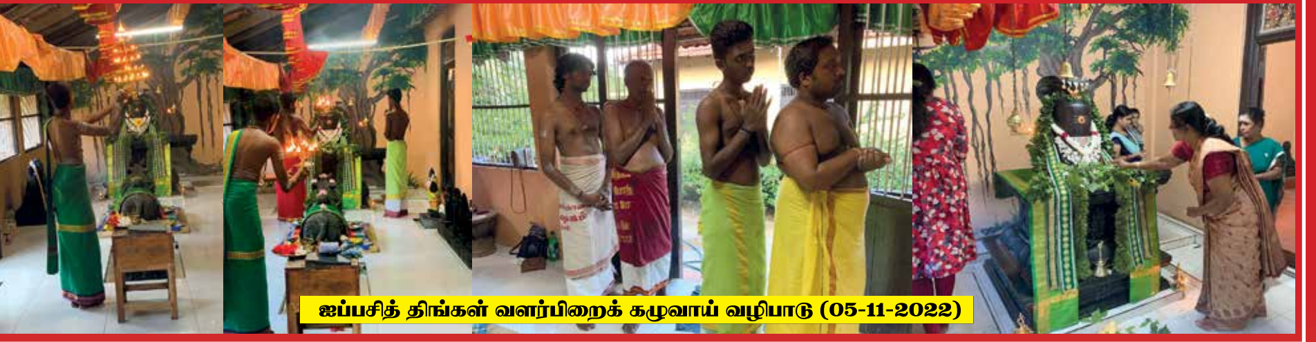
ஐப்பசித் திங்கள் வளர்பிறைக் கழுவாய் வழிபாடு (05-11-2022)