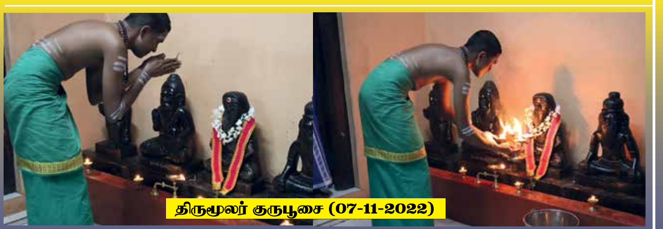
திருமுலர் திருபூசை (07-11-2022)