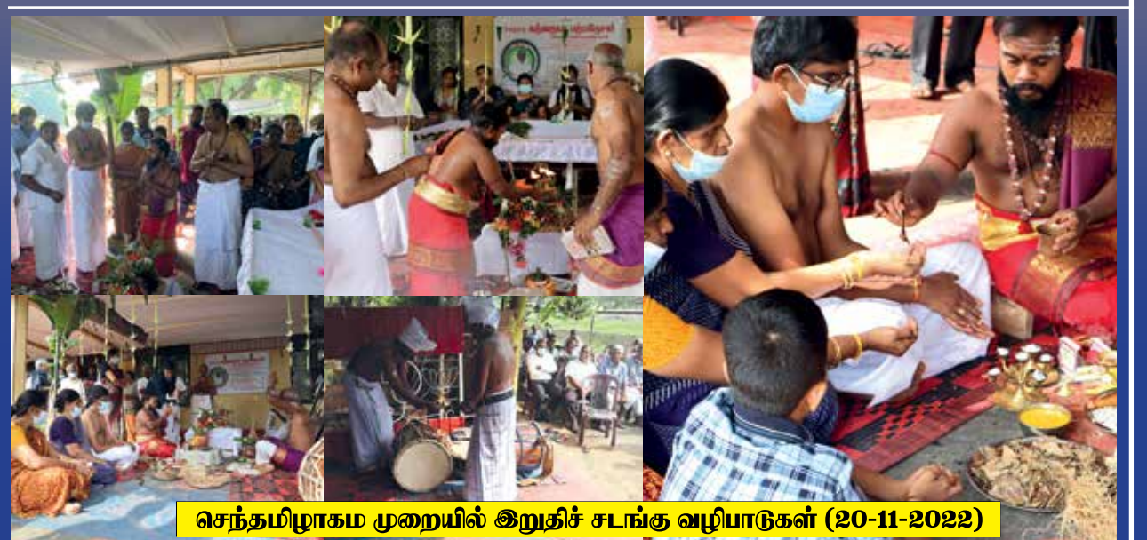
செந்தமிழாகம முறையில் இறுதிச் சடங்கு வழிபாடுகள் (20-11-2022)