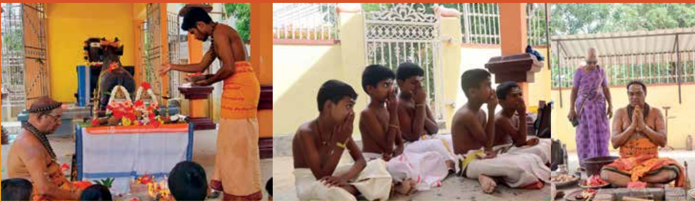
கொக்குவில் இந்து ஆரம்பப் பாடசாலையில் நுழைவு தீக்கை (சமய தீக்கை) வழங்கல் (30-08-2023)