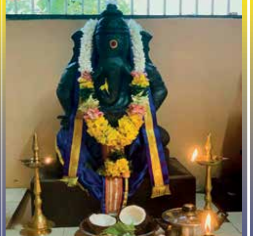
தென்னாட்டில் விநாயகர் சதுர்த்தி சிறப்பு வழிபாடுகள் (18-09-2023)