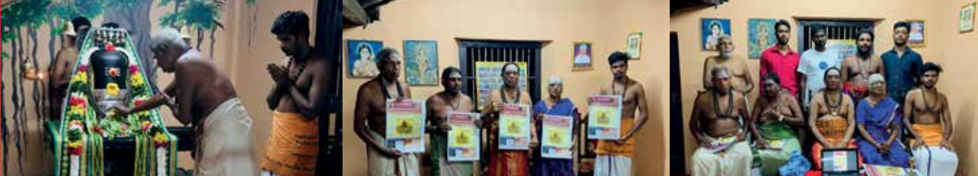
ஆவணித் திங்கள் நிறைமதி வழிபாடும் இதழ் வெளியீடும் (30-08-2023)