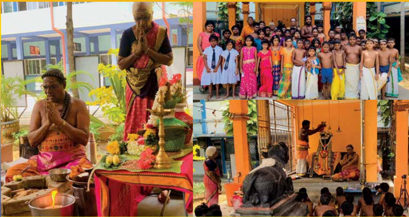
யாழ்ப்பாணம் இந்து ஆரம்பப் பாடசாலையில் நுழைவு தீக்கை (சமய தீக்கை) வழங்கல் (29-08-2023)