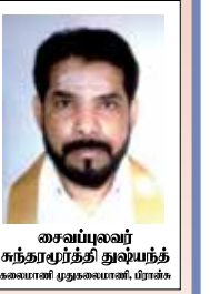
சைவபூசகர் சந்தரமூர்த்தி தெய்வநாயகம்