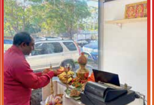
சிட்னியில் கடை திறப்புப் பூசை (குளர்காலம்)