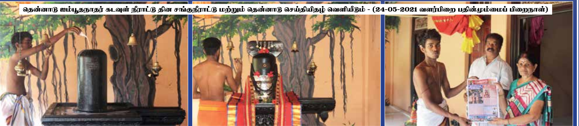
தென்னாடு ஜம்பூதநாதர் கடவுள் நீராட்டு தின சங்குநீராட்டு மற்றும் தென்னாடு செய்தியிதழ் வெளியீடும் - (24-05-2021 வளர்மிறை பதினமும்மைப் பிறைநாள்)