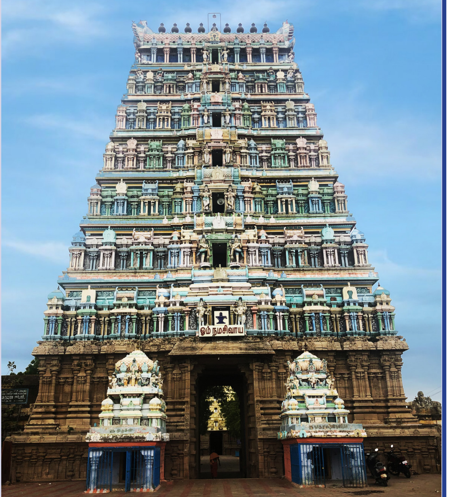
உலகின் முதல் சிவன்கோயில் உத்தரகோசமங்கை மங்களநாதப் பெருமான் திருக்கோயில் - இராமநாதபுரம்

இவ்வாறான சிவப்பணிகளுக்கு உங்களால் இயன்ற உதவிகளைச் செய்வது மற்றும் மற்றவர்களையும் “நீங்கள் பெற்ற இன்பம் பெறுக” என்று செய்விப்பது உங்களை மட்டுமல்ல உங்கள் தலைமுறையினர்களை வையத்துள் வாழ்வாங்கு வாழவைப்பதுடன், உங்கள் முன்னோர்களையும் சிவன்பால் ஆறுதலடைந்து மீண்டும் பிறப்பில்லை பேரின்பப் பெறுவாழ்வை எய்த வழிவகுக்கும். இது திருநீலகண்டத்தின் மேல் ஆணை.