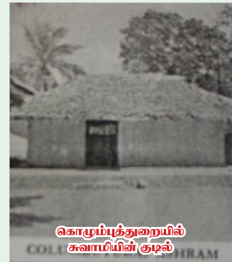
கொழும்புத்துறையில் சுவாமியின் குழல்