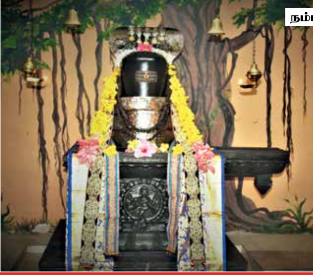
நம்மியாண்டர் நம்மி குருபுசை