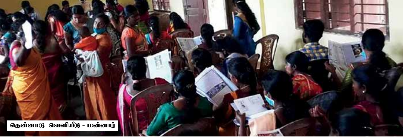
தென்னாடு வெளியீடு - மன்னார்