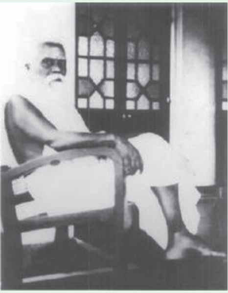
(யோகர் சுவாமிகள் கடந்த மாத தொடர்ச்சி)