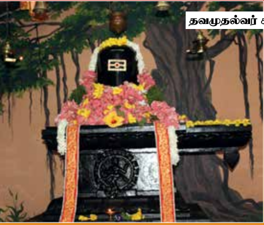
தவமுதல்வர் சம்பந்தர் குருபுசை