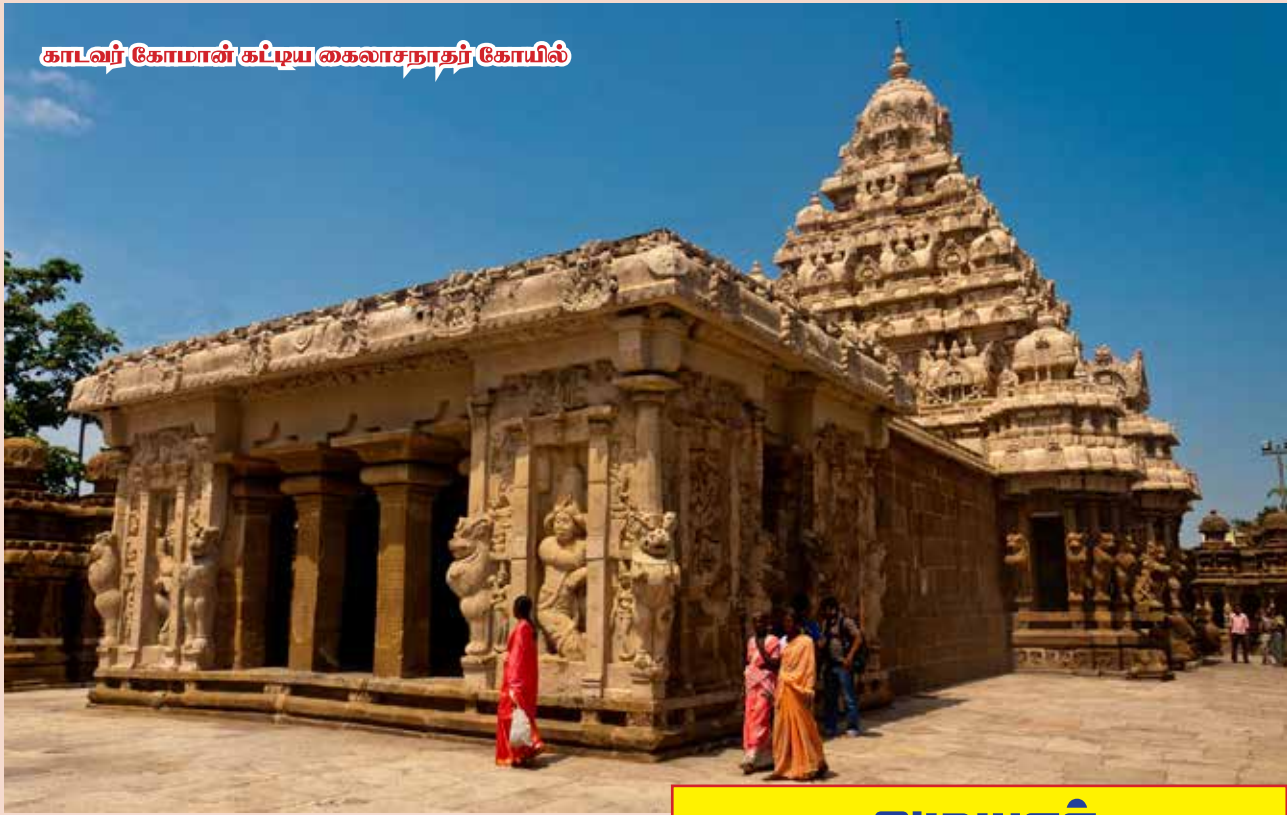
காடவர் கோமான் கட்டிய கைலாசநாதர் கோயில்