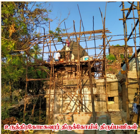
உருத்திரகோசுவார் திருக்கோயில் திருப்பணிகள்

நாள் பூசைகள், திருவிழாக்கள் முதலியன எந்தவித முட்டுப்பாடுமின்றி தொடர்ந்து நடைபெறுதல் வேண்டும். எமது திருக்கோயில்களில் பன்னிரு திருமுறைகள் ஓயாது ஒலித்தல் வேண்டும். ஆகமங்களில் சொல்லப்பட்ட முறைதவறி நடப்பின், நாட்டில் தீர்க்கலாகாத நோய்கள் பரவி, மழையும் பொய்த்துப் போகும், அரசருக்கு கேடு உண்டாகும். ஆகவே, எமது கோயில்களை பாதுகாப்பது எம்முடைய