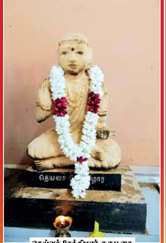
தெய்வச் சேக்கிழார் குருபுசை