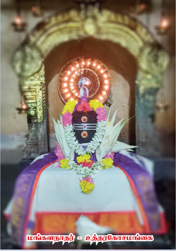
மாங்களநாதர் - உத்தரகோசமங்கை

தவம் என்ற ஒற்றை வார்த்தை சைவத்தமிழ் உலகின் மாபெரும் ஆன்மீக அலை எனலாம். இத்தகு தவம் என்றால் என்ன என்று வினவும் போது உலகிடை ஒரே ஒரு விடை மட்டும் பரந்து ஒலிக்கின்றது. காவி பூண்டு, கமண்டலம் தூக்கி காட்டிற்கு செல்லுதலே தவம் என்று உலகு இயம்புகின்றது. ஆனால் அஃது இல்லை தவம். மந்திரம் கூறலே தவம் என்று இன்னொரு பகுதி கூறுகின்றது. ஆனால் அதுவும் இல்லை தவம். அப்படி என்றால் அந்த தவம் யாது? தவம் என்று கூறுவதன் பொருள் யாது என்று வினவின் அதற்கான அர்த்தத்தை அன்று வள்ளுவரே கூறி விட்டார்.