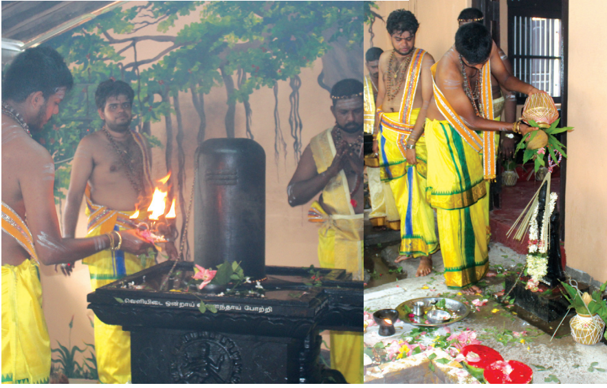
ஐம்பூத நாதரின் திருக்குடமுழுக்கு நன்னாள் புதிவுகள்