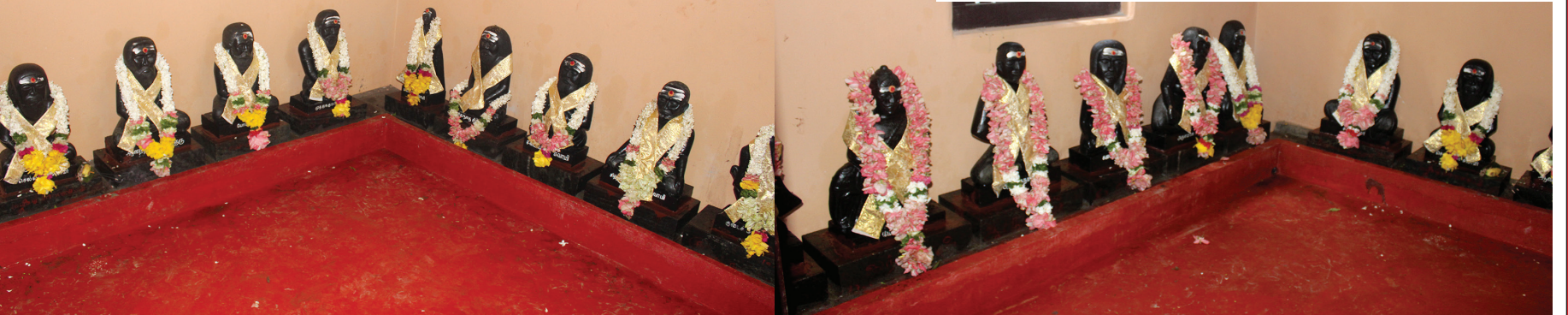
தென்னாட்டில் எழுந்தருளியுள்ள சித்தர்களின் அருட்கோலம்