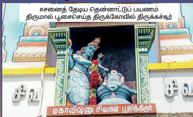
ஈசனைத் தேடிய தென்னாட்டுப் பயணம் திருமால் பூசைசெய்த திருக்கோவில் திருக்கச்சூர்