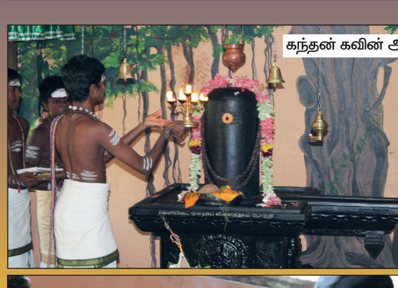
கந்தன் கவின் அறுமை மற்றும் சூரன் பெருவாழ்வு