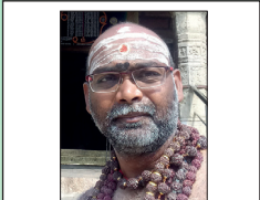
சிவத்திரு குமரேசன் இராஜசிம்மன்

(தேவாரப் பாடல்பெற்ற 274 சிவபுரங்களில் 259வது திருக்கோவில் திருக்கச்சூர்)