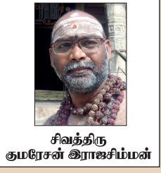
சிவத்திரு குமரேசன் இராஜசிம்மன்

தேவாரப் பாடல்பெற்ற 274 சிவபுரங்களில் 36வது திருக்கோவில் - திருஆவடுதுறை அமைவிடம்: (மயிலாடுதுறை - தமிழ்நாடு) மயிலாடுதுறையில் இருந்து 20 கி.மீ. தொலைவிலும், மயிலாடுதுறை - கும்பகோணம் புகையிரத வழியில் உள்ள நரசிங்கன்பேட்டை புகையிரத நிலையத்தில் இருந்து கிழக்கே 3 கி.மீ. தொலைவிலும் இத்தலம் இருக்கிறது. மயிலாடுதுறை - கும்பகோணம் சாலை வழியில் உள்ள திருவாலங்காடு என்ற பேருந்து நிறுத்தத்தில் இறங்கி 1 கி.மீ. ஒரு கிளைப் பாதையில் நடந்து சென்றால் இத்தலத்தை அடையலாம்.