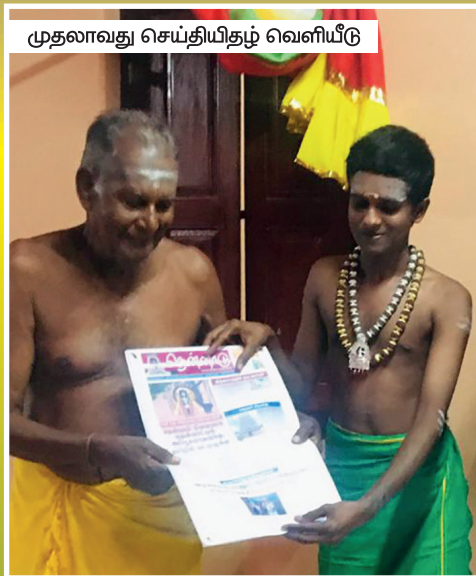
முதலாவது செய்தியிதழ் வெளியீடு