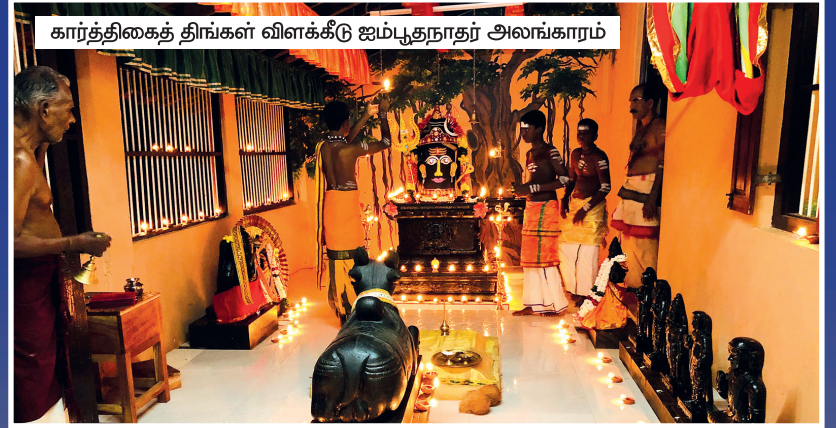
கார்த்திகைத் திங்கள் விளக்கீடு ஐம்பூதநாதர் அலங்காரம்