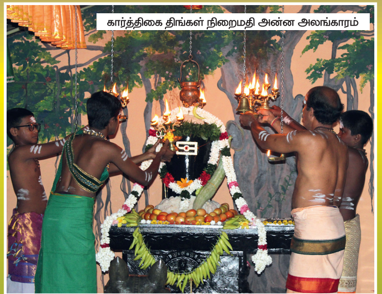
கார்த்திகை திங்கள் நிறைமதி அன்ன அலங்காரம்