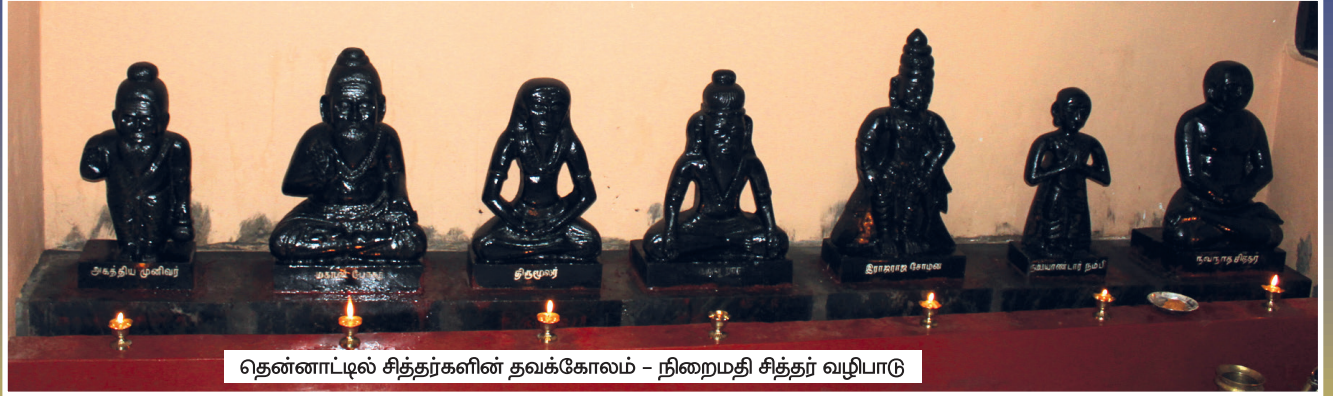
தென்னாட்டில் சித்தர்களின் தவக்கோலம் - நிறைமதி சித்தர் வழிபாடு