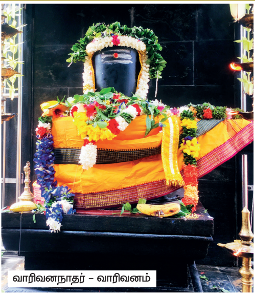
வாரிவனநாதர் - வாரிவனம்