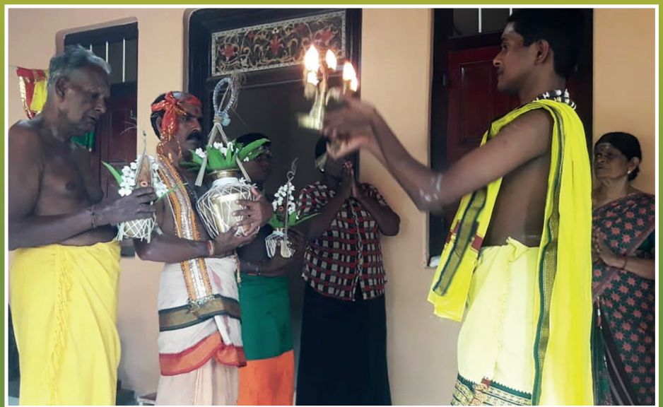
கூத்தப்பெருமானுக்கு செந்தமிழில் நன்னீராட்டு-கார்த்திகைத் திங்கள் எழுமைப் பிறைநாள்