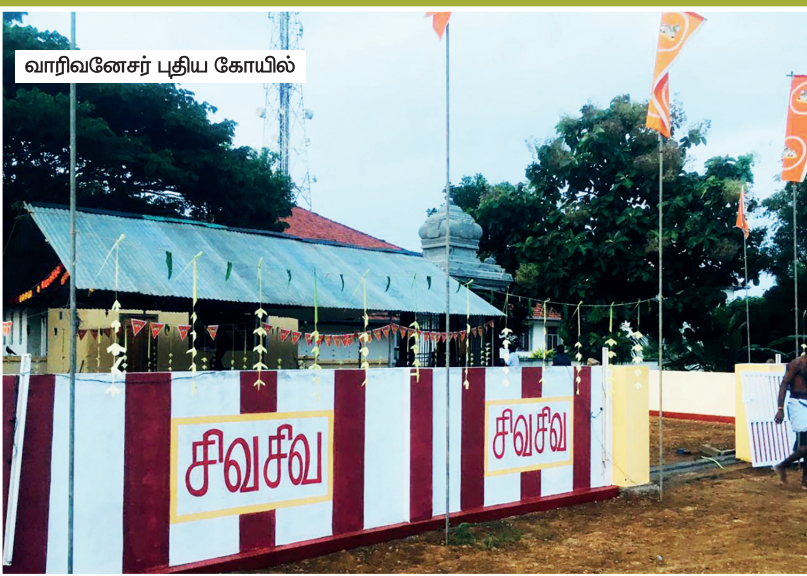
வாரிவனேசர் புதிய கோயில்