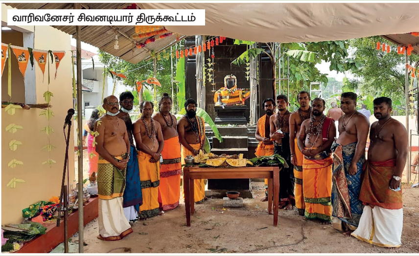
வாரிவனேசர் சிவனடியார் திருக்கூட்டம்