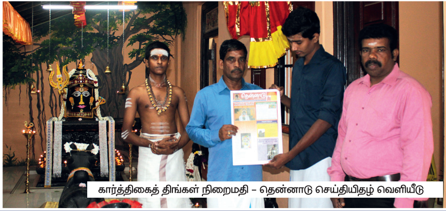
கார்த்திகைத் திங்கள் நிறைமதி - தென்னாடு செய்தியிதழ் வெளியீடு