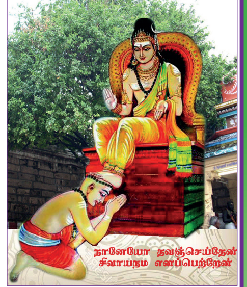
நானேயோ தவஞ்செய்தேன் சீவாயநம எனப்பெற்றேன்

அம்பாள் பூசை செய்தது காஞ்சிபுரம், முருகன் பூசை செய்தது திருமுருகன் பூண்டி, பிள்ளையார் பூசை செய்தது கணபதீச்சரம், பிரமாவணங்கியது பிரம்மபுரீசுவரம், இராமர் வணங்கியது இராமேசுவரம், கிருஷ்ணர் வணங்கியது சீர்காழி, பரசுராமர் பூசை செய்தது திருப்பாச்சூர், வாமணர் பூசை செய்தது திருமாணிக்கூழி, மச்சன் பூசை செய்தது மச்சேசுவரம், கச்சன் பூசை செய்தது திருக்கச்சூர் இப்படியாக எல்லோரும் சிவனை வழிபட்டுத் தான் பலன் பெற்றனர். அப்படியான சிவபெருமானின் சிவபரத்துவத்தினையே உணர்ந்துகின்றன இந்தப்பதிக வரிகள்.