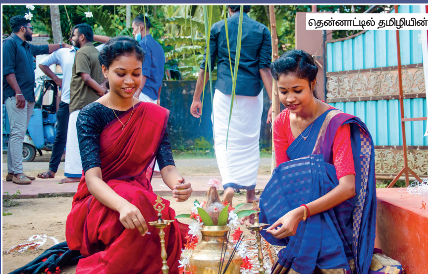
தென்னாட்டில் தமிழியின் "காணும் பொங்கல்"