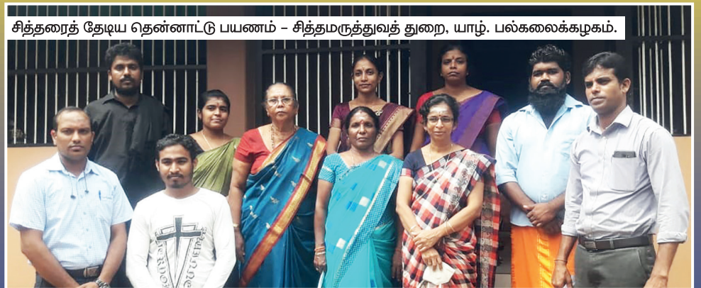
சித்தரைத் தேடிய தென்னாட்டு பயணம் - சித்தமருத்துவத் துறை, யாழ். பல்கலைக்கழகம்.